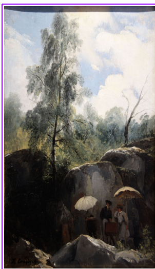
Peintres dans la forêt de Fontainebleau Jules Coignet