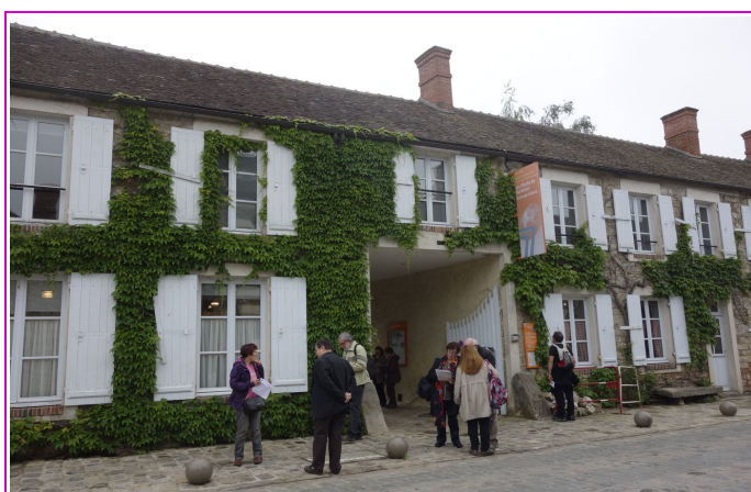
Devant l'auberge Ganne