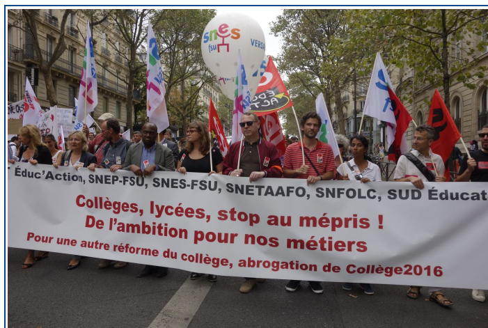
Manifestation du jeudi 8 septembre 2016