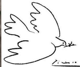
Une colombe pour la Paix

Conférence-débat organisée par le S1 des retraités de Paris. Crise grecque : leçons à tirer pour le fonctionnement et l'avenir de l'Europe.